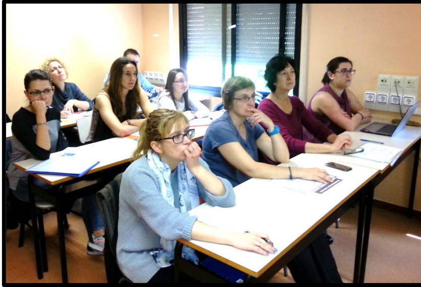
Grupo de asistentes al módulo de Nutrición y Disfagia